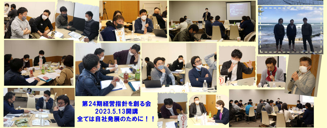
第24期経営指針を創る会 2023.5.13開講 全ては自社発展のために！！

6月にスタートした「第23期経営指針を創る会」最後の講座が合宿にて行われました。自分に向き合い自社の未来を考え、想いの先にひたすらに対峙してきた1年。受講生だけでなく委員やOBの方たちも、指針を創る会に真摯な想いを持って参加することで自社発展につながる気づきや学びは大きかったはず。3月18日はよいよ発表会。指針書を創ることが終わりではなく、そこから実践していくためのスタートの場。受講生の初めの一步を皆さんで応援しませんか？