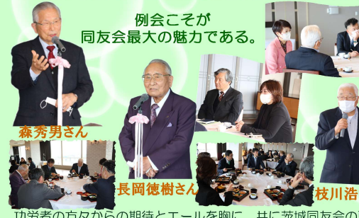
功労者の方からの期待とエールを胸に、共に茨城同友会の更なる革新へ！！