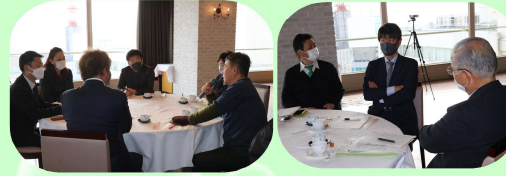
例会での学びをいかに自社経営に落とし込み実践できるか。

【開催主旨】 功労者の方々と今の茨城同友会の現状を共有し、 現会員が茨城同友会の歴史を知り理解し、 共に未来の茨城同友会に反映させていく